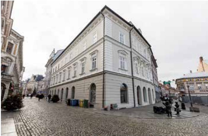
Kamienica przy ul. Ratuszowej 2