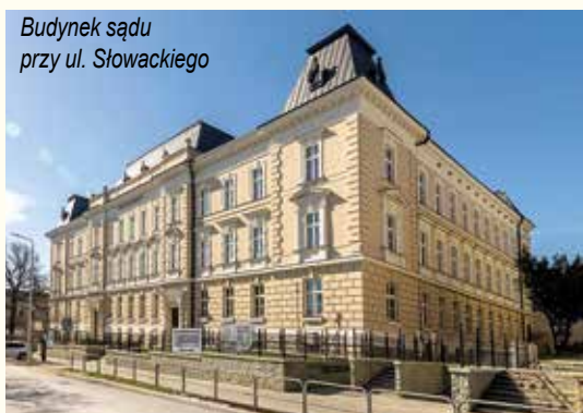
Budynek sądu przy ul. Słowackiego