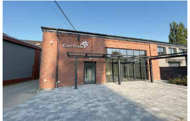
Magazyn przy ul. Grażyńskiego 53