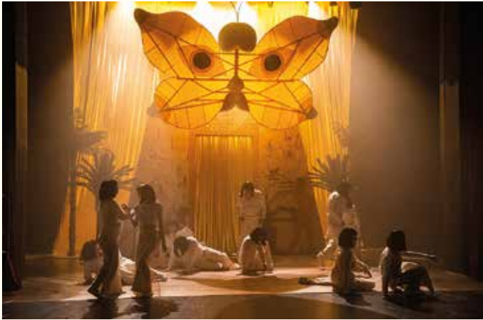
Scena ze spektaklu Faraon