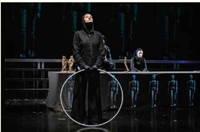
Scena z przedstawienia Zakazane dzieci – opowieść Korczakowska

Zwykle w każdej kategorii przyznaje się trzy nominacje, tym razem było inaczej – ponieważ nie przyznano żadnej nominacji w kategorii aktorstwo za rolę wokalnno-aktorską, nominacji do nagród specjalnych było aż sześć. mt