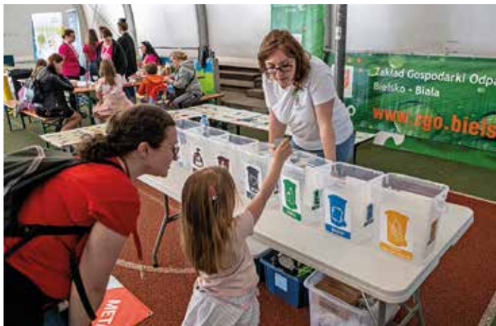
Ekowarsztaty w Parku Słowackiego