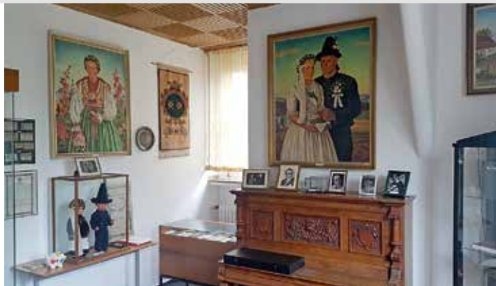
Izba pamięci poświęcona bielskim Niemcom w Lippstadt; kadr z filmu

Po wojnie w Bielsku zostało niewiele Niemców; wróciła za to część bielskich Żydów, ale jakby niepełnie do siebie i na krótko. Zdecydowaną większość nowych mieszkańców stanowiła ludność napływowa, która weszła w nie-