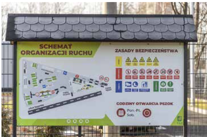
Mapka nowego PSZOK-u