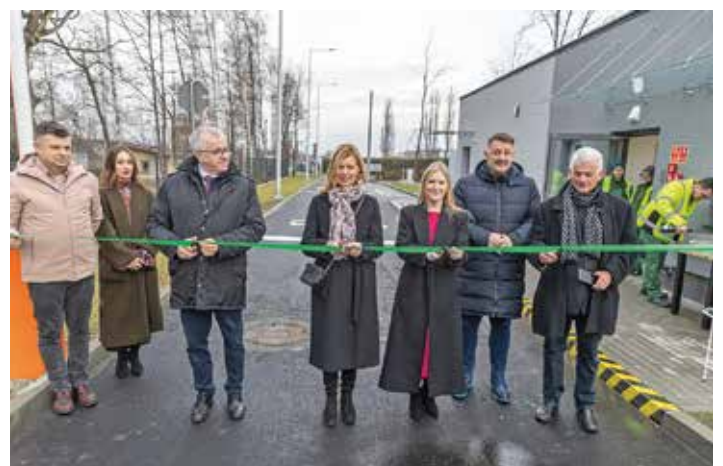
Moment przecinania wstęgi podczas otwarcia PSZOK-u przy ul. Szyprów 7 stycznia