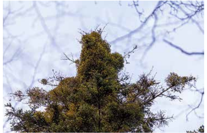
Jodła zaatakowana przez jemiolę