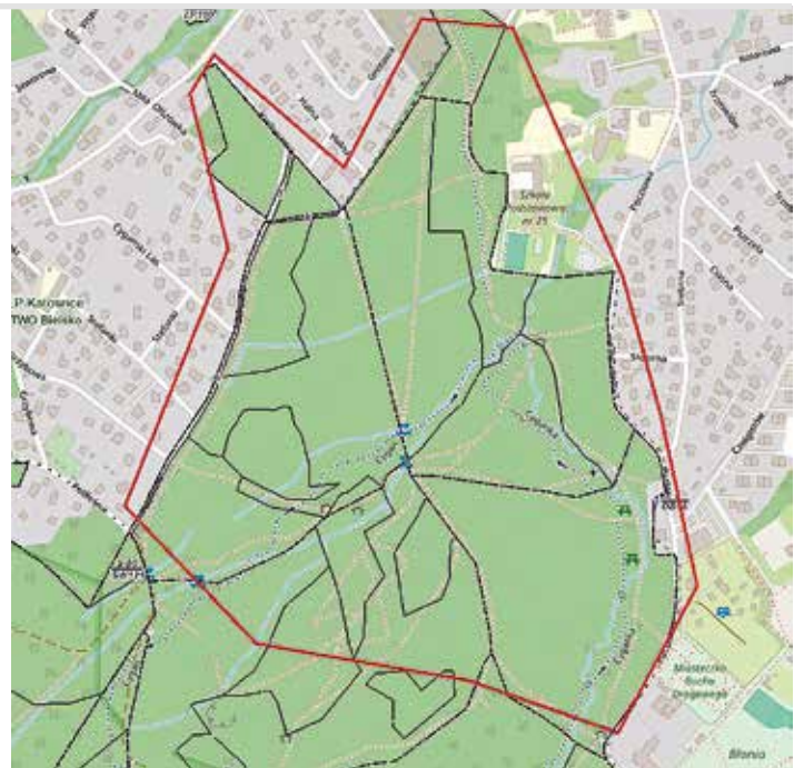
Mapa terenu objętego wycinką; materiały Wydziału Gospodarki Miejskiej Urzędu Miejskiego w Bielsku-Białej

Właśnie podczas przeglądu drzewostanu w Cygańskim Lesie leśnicy