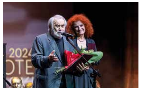
Nagroda im. Leny Starke dla Eugeniusza Jachyma