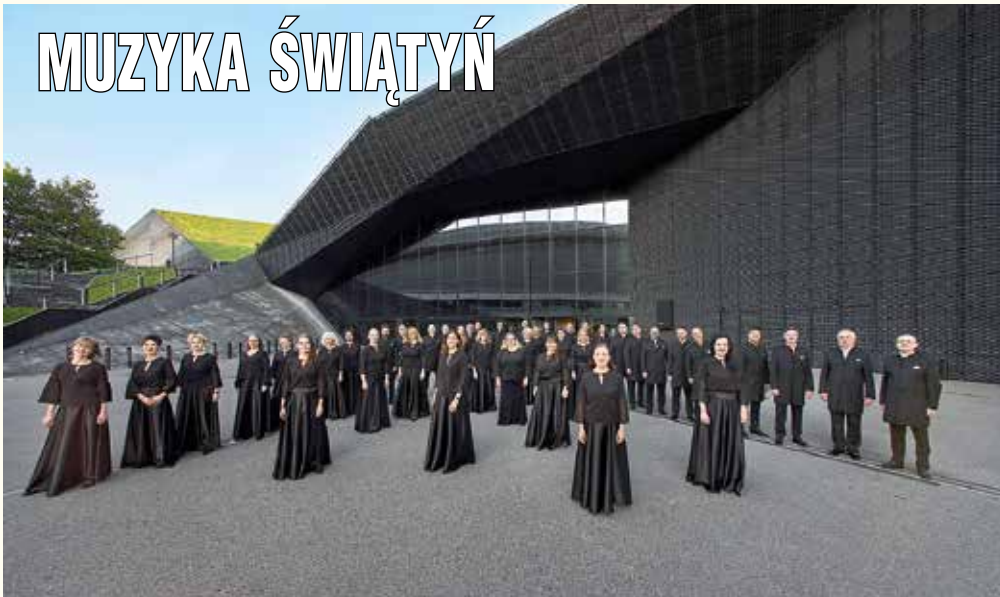
Chór Filharmoników Katowickich

Nastał kwiecień, więc niezmiennie – od 23 lat – Bielskie Centrum Kultury im. Marii Koterbskiej zaprasza swoją publiczność na spotkanie z muzyką ze sfery sacrum. 22-25 kwietnia odbywać się będą koncerty 24. Międzynarodowego Festiwalu Muzyki Sakralnej na Podbeskidziu Sacrum in Musica.