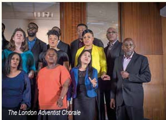
The London Adventist Chorale